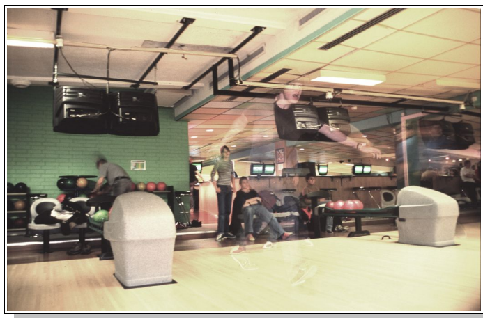
RFSU och Spejarna bowlar

För Årsta Scoutkår av Svenska Scoutförbundet verksamhetsåret 2005