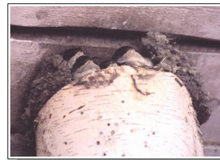
Svalor på Lillgårn, Vässarö