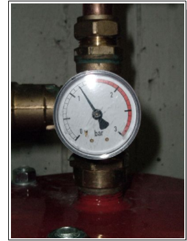
Det är inte alla dagar trycket är så här bra i systemet