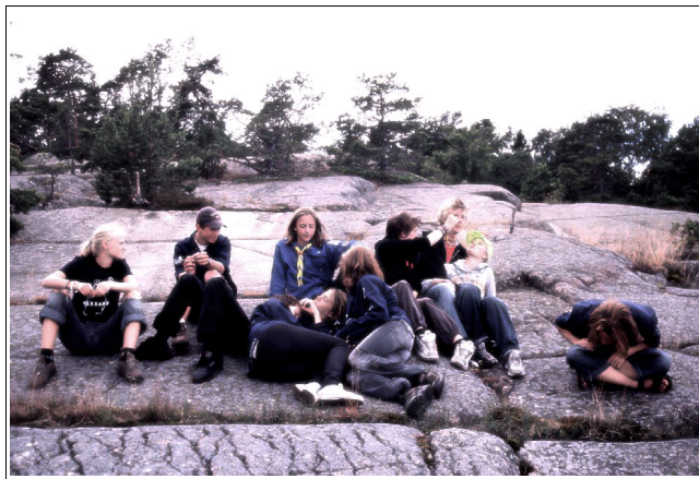
Konfirmander på Trapperspåret, Vässarö, sommaren 2005

Ett stort tack till alla kårfunktionärer, ledare, föräldrar och sponsorer som under året ställt upp för kåren i år och under mina år i styrelsen. Vi ses ute i de ljusa vårmärkerna.