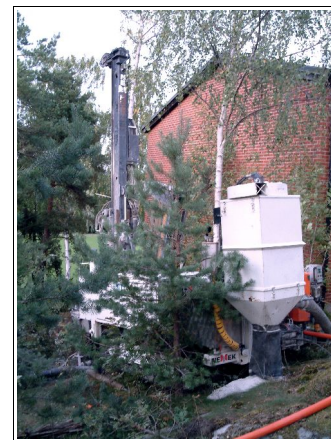
Tre hål om ca 190 meter var borrades på en vecka