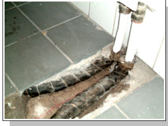
Fukt i golvet på lilla toaletten, men varifrån?

Under året har båda varmluftsfläktarna setts över och trasiga delar bytts, så nu fungerar båda stabilt igen. Däremot läcker fortfarande värmesystemet vatten någonstans och utsugsfläktarna behöver gås igenom.